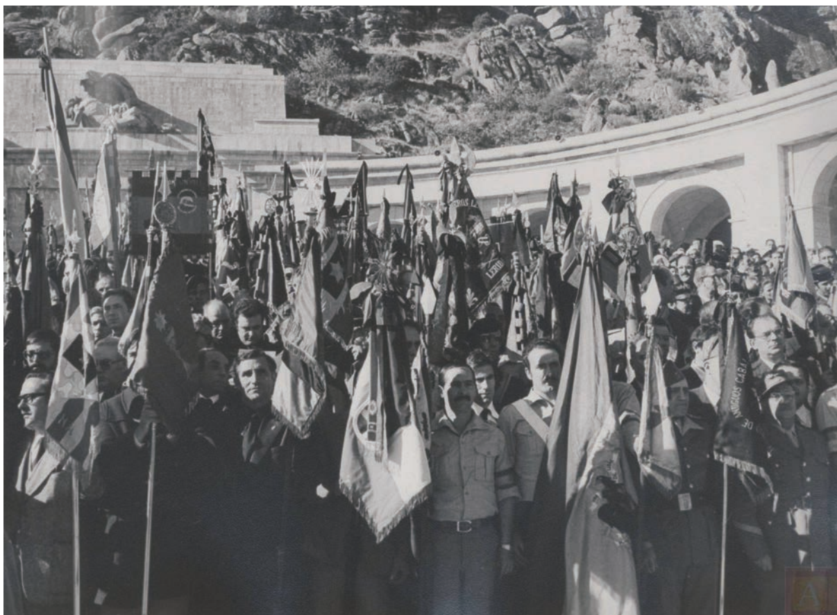
Colectivos falangistas y de excombatientes en el Valle de los Caídos durante el entierro de Franco (Archivo General de la Administración).

los proyectos en presencia, de los actores políticos y sociales que los encarnaban y de los apoyos obtenidos en la sociedad española. Ninguno de los tres proyectos se materializó tal como se había formulado inicialmente. El continuismo quedó pronto en vía muerta, pero no puede menospreciarse su influencia y se transformó en involucionismo, incluido el golpismo. El reformismo del gobierno Suárez empezó a desnaturalizarse después de la aprobación de la Ley para la Reforma Política en diciembre de 1976, que establecía la convocatoria de unas elecciones a Cortes, pero sin garantizar que fueran unas elecciones libres y, menos aún, constituyentes. A partir de enero de 1977 tuvo que optar por romper los límites de una reforma del régimen convocando unas elecciones que permitieran la expresión de la voluntad