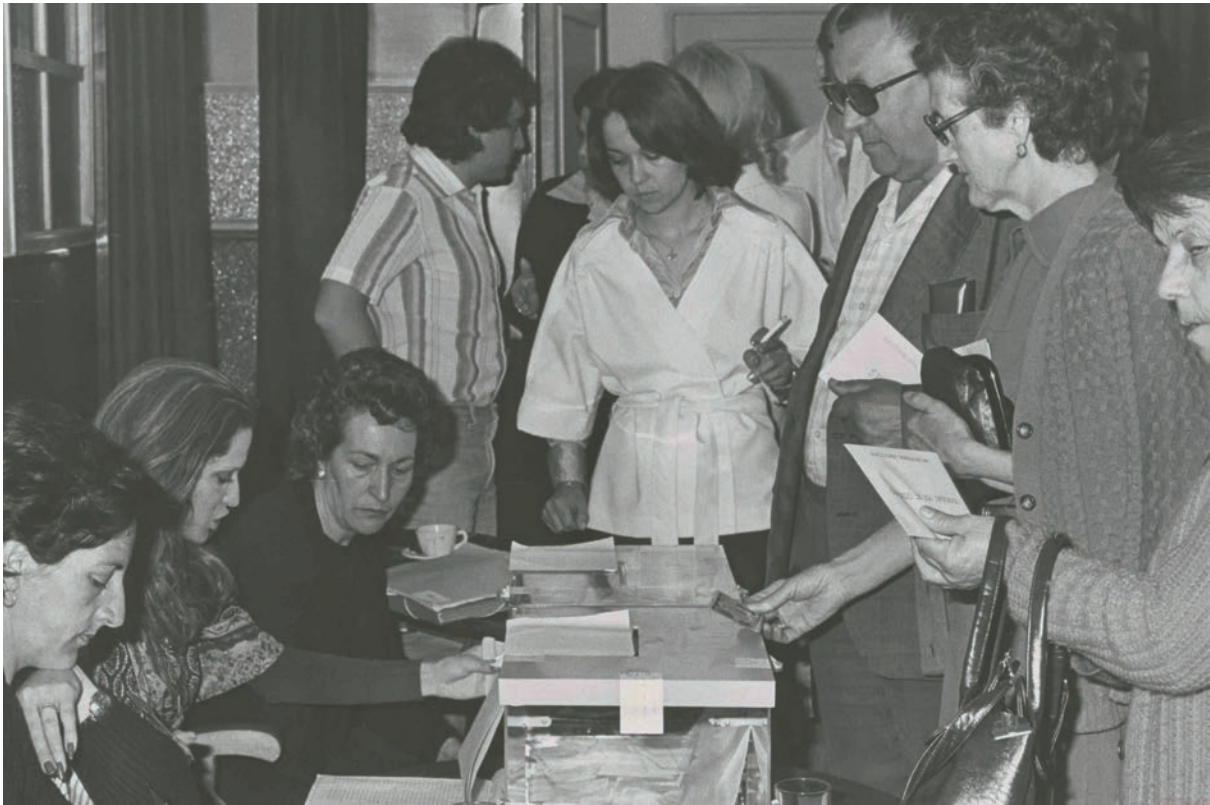
Mesa electoral el 15 de junio de 1977 en Madrid (Archivo General de la Administración).

¿Crees que debería procurarse introducir una visión más compleja de esos años en el currículum docente preuniversitario?