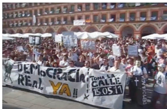
Fotograma del décimo segundo del vídeo, usado en la película Rey Heredia, Diez años de dignidad . Este fotograma del vídeo colgado por el periodista Alberto Almansa en su canal de YouTube 7 Olas , que titula «Manifestación democracia real en Córdoba», fue tomado en la Plaza de la Corredera, en la manifestación del 15 de mayo de 2011 en Córdoba. Una pancarta gigante hecha a mano reivindica también una «democracia real ya». La pancarta de DRY Córdoba repite el llamamiento «a tomar las calles» el 15 de mayo de 2011, en letras mayúsculas, con el uso del color amarillo para acentuar el «Ya». En el extremo izquierdo se dibujan unas marionetas con unas tijeras que amenazan con cortar los hilos que las sostienen. El par de tijeras y la línea de puntos, símbolo recurrente de los recortes presupuestarios, se repite en el extremo derecho, como para subrayar que el recorte vendrá de la calle, con el mensaje «Toma la calle 15.05.11».

de la Transición y puede simbolizar el fin de una doble ilusión: la de la democratización de España como proceso culminado y la de la pertenencia a la UE como sinónimo de futuro próspero. Abre un ciclo de contestación y reflexión sobre la democracia en España, reclamando una redefinición de las reglas hacia una mayor soberanía popular.