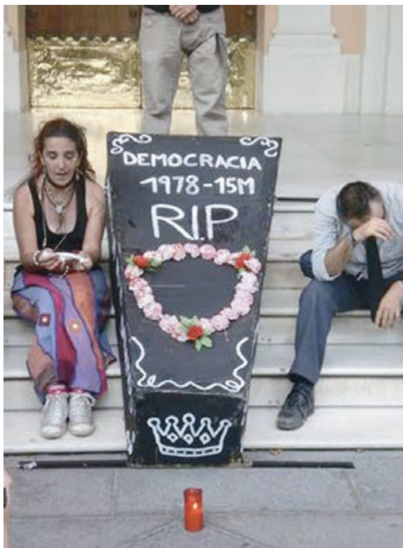
Fotografía reproducida por Germán Labrador Méndez en su artículo sobre la crítica estética de la política de la Transición española y el imaginario de la historia en el 15M, publicado en 2014. Una mujer joven parece recitar un homenaje póstumo mientras un hombre con corbata finge llorar. Sobre el féretro de la democracia: 1978—15M serían las fechas de su vida y de su muerte, con el símbolo de la monarquía. El RIP es la clásica inscripción cristiana: Requiescat In Pacem . La corona de flores y el cirio rojo, típico de los que se encienden en las iglesias católicas, completan la escenificación —en la Puerta del Sol, epicentro del país— de la «muerte» de la democracia del régimen de 1978. 21 de mayo de 2011, Puerta del Sol, Madrid.

de la Transición y puede simbolizar el fin de una doble ilusión: la de la democratización de España como proceso culminado y la de la pertenencia a la UE como sinónimo de futuro próspero. Abre un ciclo de contestación y reflexión sobre la democracia en España, reclamando una redefinición de las reglas hacia una mayor soberanía popular.