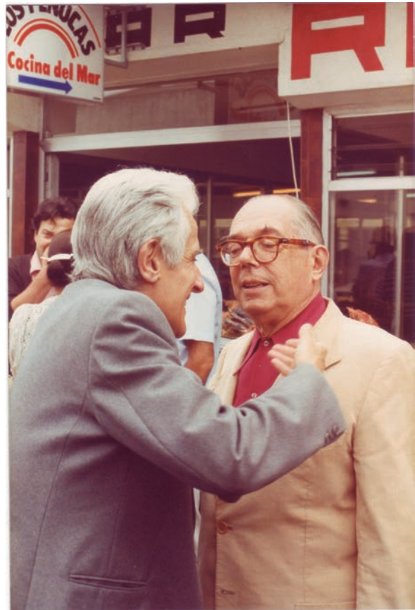
Tuñón de Lara y Pierre Vilar en 1981 (journals.openedition.org).