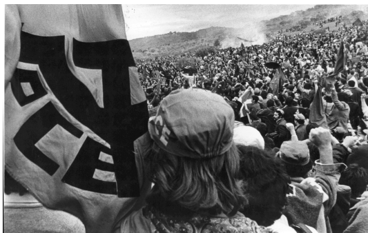
Mitin - fiesta del PCE en Torreldones Madrid, 1977.

la investigación y los debates culturales y políticas sobre la cuestión. Por esta razón una de las líneas de acción que nos hemos marcado para los próximos años pasa por organizar y colaborar en actividades de debate, investigación, puesta en común y difusión sobre la Transición española. Una primera iniciativa en este sentido podría ser la organización de una jornada de debate sobre las causas, los condicionamientos y el balance de la transición desde la izquierda de hoy. En esta línea cabe destacar asimismo los esfuerzos que