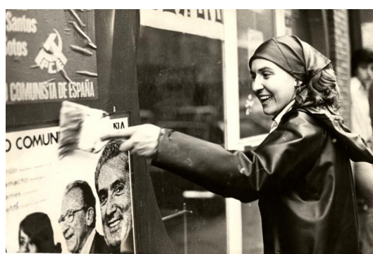
Militante comunista durante la campaña de las elecciones generales de 1977.

Como viene pasando en los años recientes, en 2014 la conmemoración de la aprobación en referéndum de la Constitución el día 6 de diciembre —fecha también de la ratificación parlamentaria de la republicana de 1931— ha visto la divergencia de planteamientos políticos sobre el significado del texto y de los actos oficiales en su recuerdo, con la denuncia por la izquierda del vaciamiento e incumplimiento de los derechos sociales constitucionales, así como numerosas voces en defensa de una reforma constitucional o un proceso constituyente. Si es cierto que el pasado y el presente están siempre enlazados, en torno a la transición se ponen de manifiesto con toda claridad las relaciones entre actualidad política, visión del pasado y proyecto de futuro, que están contribuyendo a la revisión del pasado reciente, como puede comprobarse tanto en el debate público como en el creciente número de investigaciones, encuentros y ensayos sobre la cuestión.