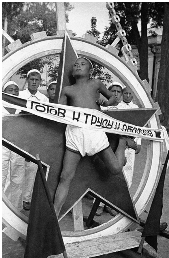
Manifestación en la Plaza Roja de Taskent (Uzbekistán), en la cinta puede leerse «Listo para la defensa y el combate», en 1930.

Mientras tanto el estado soviético, bajo la dirección de Stalin, vivía con el miedo de ser agredido desde fuera e invertía en armas para su defensa unos recursos que podían haber servido para mejorar los niveles de vida de sus ciudadanos. Pero la peor de las consecuencias de este gran temor fue que degenerara en un pánico obsesivo a las conspiraciones interiores que creían que se estaban preparando para colaborar con algún ataque desde el exterior destinado a acabar con el estado de la revolución. Un miedo que fue responsable de las más de setecientas mil ejecuciones que se produjeron en la Unión Soviética de 1936 a 1939. La orden 00447 de la NKVD, de 30 de julio de 1937, «sobre la represión