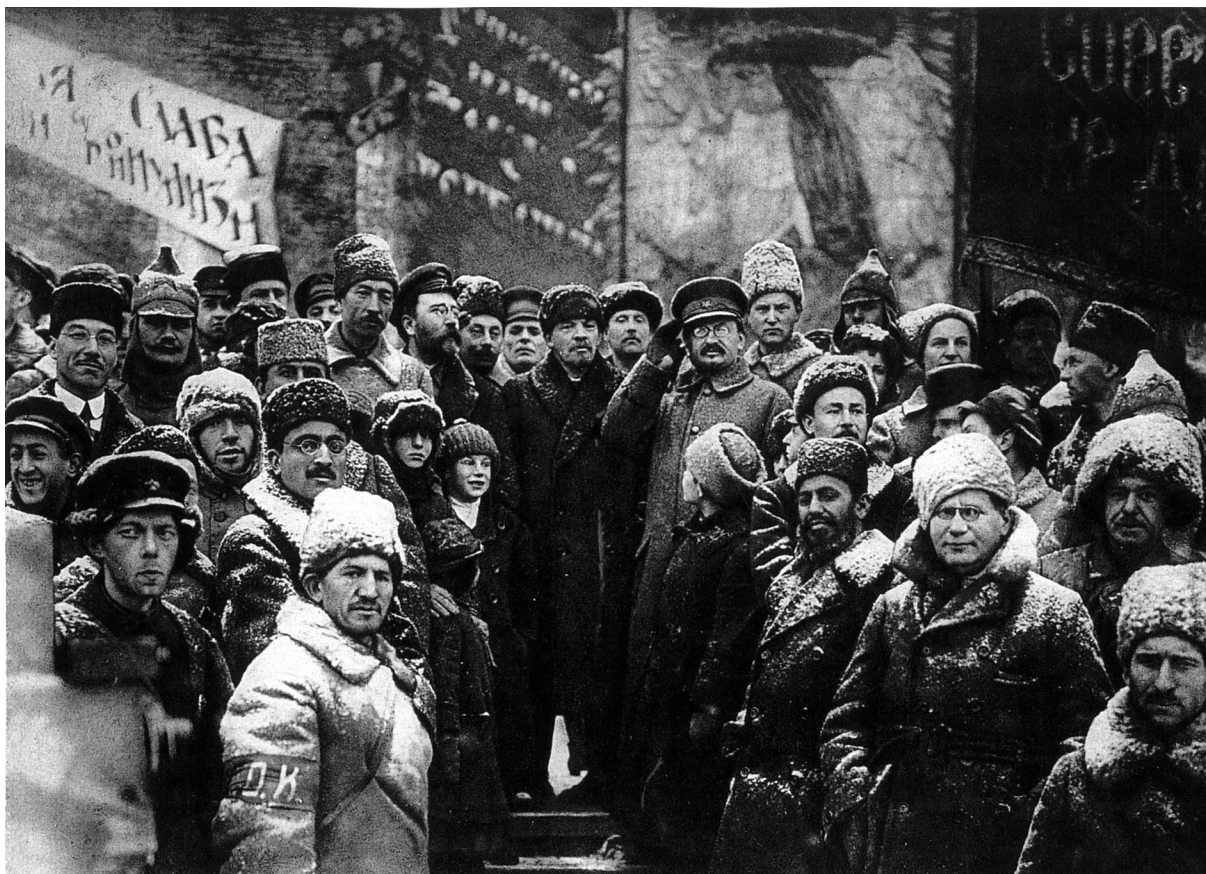
Líderes soviéticos en la Plaza Roja de Moscú en 1919, durante el segundo aniversario de la Revolución de Octubre

y bolcheviques, no solamente no tenía representación en el parlamento, sino que era perseguido por la policía. A comienzos de 1917 los bolcheviques tenían algunos de sus dirigentes desterrados en Siberia, como Stalin y Kamenev, mientras otros vivían en el exilio, como Lenin, que se había instalado en Suiza, en la ciudad de Zúrich, mientras Trotsky se encontraba entonces en Nueva York.